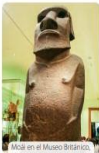
Moai en el Museo Británico, Inglaterra.