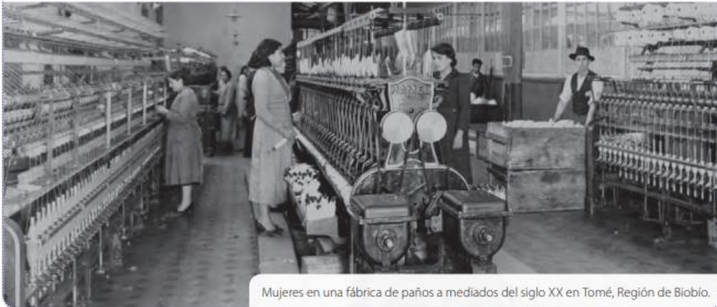
Mujeres en una fábrica de paños a mediados del siglo XX en Tomé, Región de Biobío.

Si bien desde fines del siglo XIX algunas mujeres de los sectores populares trabajaban de manera informal como lavanderas o costureras, durante el siglo XX, lograron integrarse al mercado laboral formal, realizando trabajo especializado, ya sea como profesoras, enfermeras, médicas, técnicas o empleadas públicas.