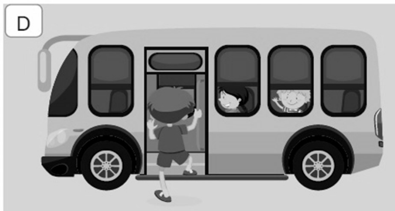
D) Get on a bus