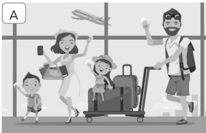
A) Go on holidays