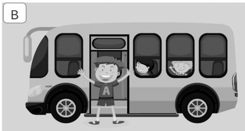
B) Get off a bus