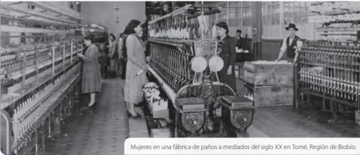
Mujeres en una fábrica de paños a mediados del siglo XX en Tomé, Región de Biobío.

Si bien desde fines del siglo XIX algunas mujeres de los sectores populares trabajaban de manera informal como lavanderas o costureras, durante el siglo XX, lograron integrarse al mercado laboral formal, realizando trabajo especializado, ya sea como profesoras, enfermeras, médicas, técnicas o empleadas públicas.