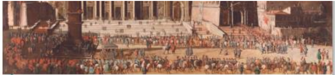
C Codazzi, Viviano (aprox. 1630). Basílica de San Pedro, Roma. [Pintura].

Floristán, Alfredo (coord.) (2005). Historia Universal Moderna.