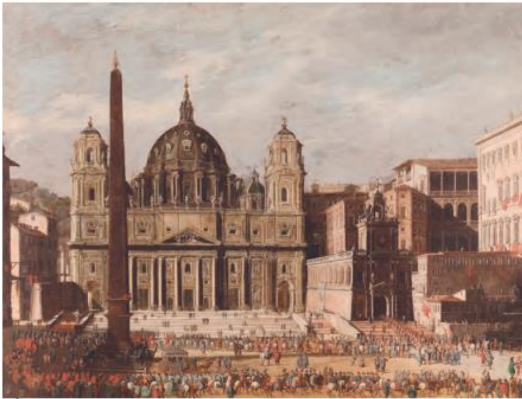
C Codazzi, Viviano (aprox. 1630). Basílica de San Pedro, Roma . [Pintura].

La Basílica de San Pedro, ubicada en el Vaticano, es considerada la más grande de todas las iglesias del mundo cristiano. Su construcción comenzó en 1506 por orden del papa Julio II y requirió de muchos recursos, lo que significó tributos y recaudaciones extraordinarias. En este contexto, el papa sucesor, León X, publicó una bula en 1515 en la que solicitaba donativos para terminar la obra de la basílica a cambio de indulgencias, es decir, el perdón de los pecados por mediación de la Iglesia. A esto le siguió la venta de indulgencias para recaudar dinero.